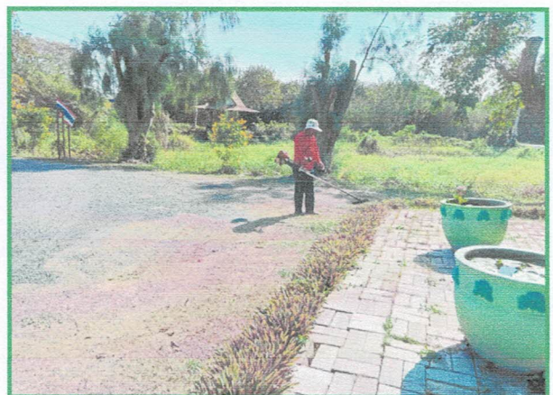
ภาพหลังทำกิจกรรม