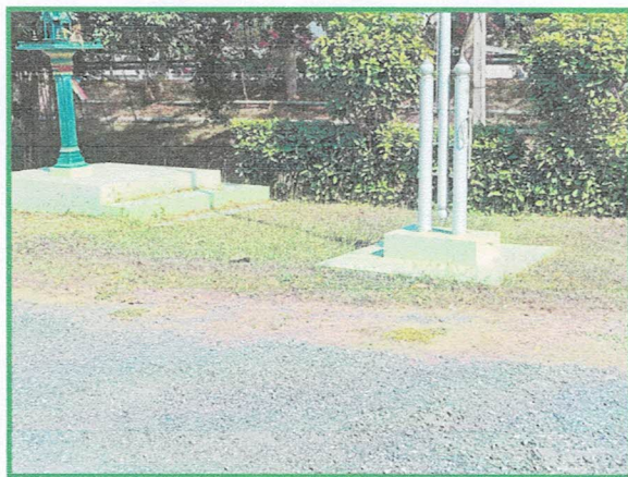
ภาพก่อนทำกิจกรรม